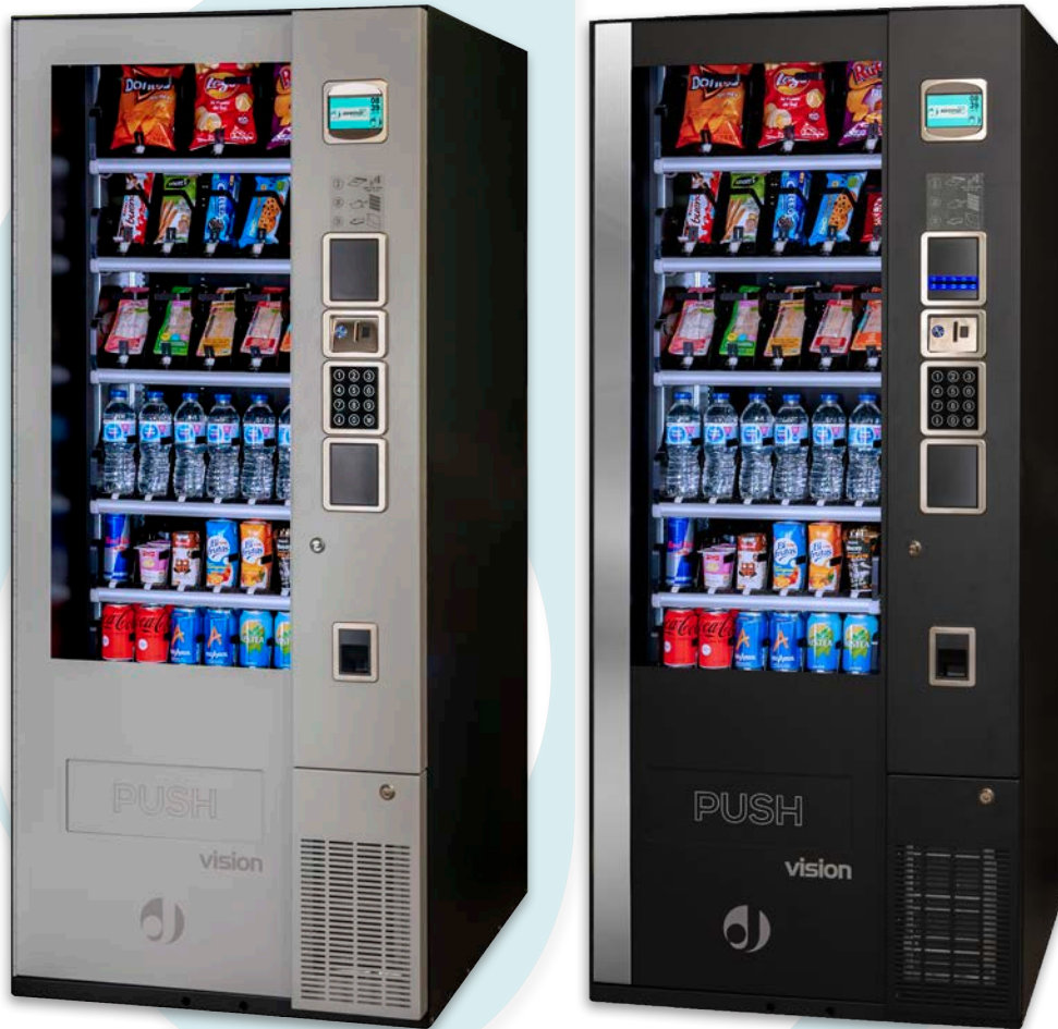
EasyCombo V8 Control total

La Vision EasyCombo V8 de Jofemar permite la conexión de hasta 3 módulos satélite, ampliando notablemente la capacidad de productos.