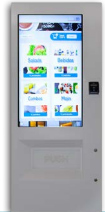
VISION ESPLUS TOUCH V8

6 bandejas de hasta 10 canales y 2 de hasta 7 can. Grupo frío opcional Sin ascensor