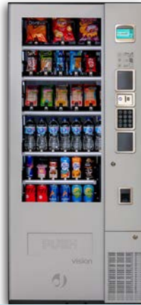
VISION EASYCOMBO V8

8 bandejas de hasta 10 canales Grupo frío opcional Con ascensor