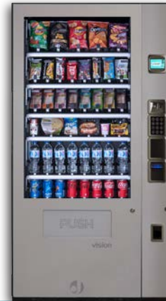
VISION ESPLUS V8 + UNIDAD DE CONTROL

6 bandejas de hasta 10 canales y 2 de hasta 7 can. Grupo frío opcional Sin ascensor