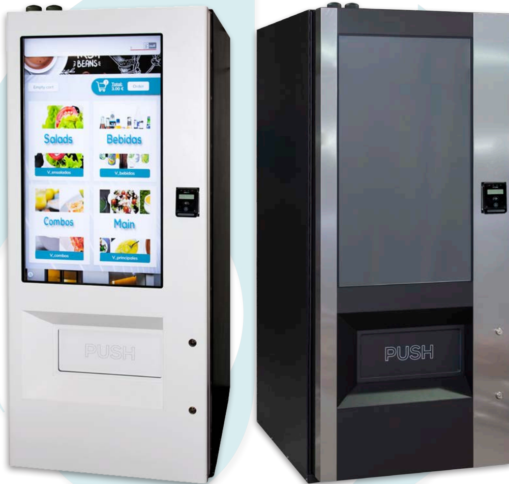
ESPlus Touch V8 Experiencia de compra

El gran distintivo de la ESPlus Touch V8 es su display; una gran pantalla táctil de 43" que facilita la experiencia de compra del usuario por hacerla más intuitiva.