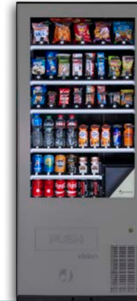
VISION SATELLITE V8

8 bandejas de hasta 10 canales Grupo frío opcional Con ascensor