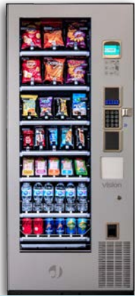
VISION COMBOPLUS V8

8 bandejas de hasta 7 canales Grupo frío opcional Con ascensor