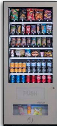
VISION ESPLUS V8

8 bandejas de hasta 7 canales Grupo frío opcional Con ascensor